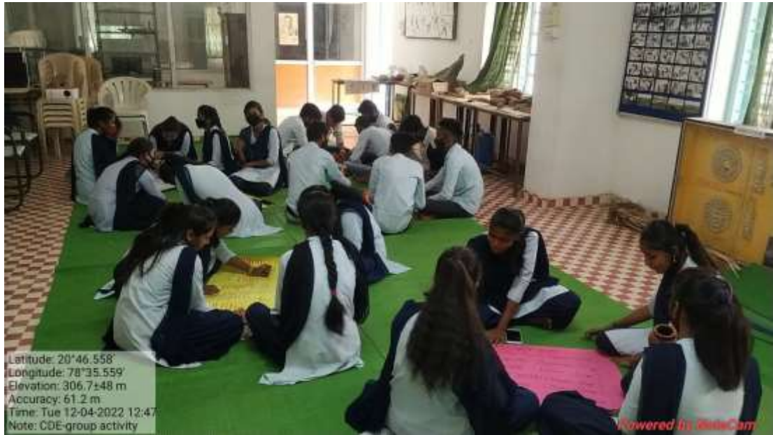
Working in groups for deeper understanding