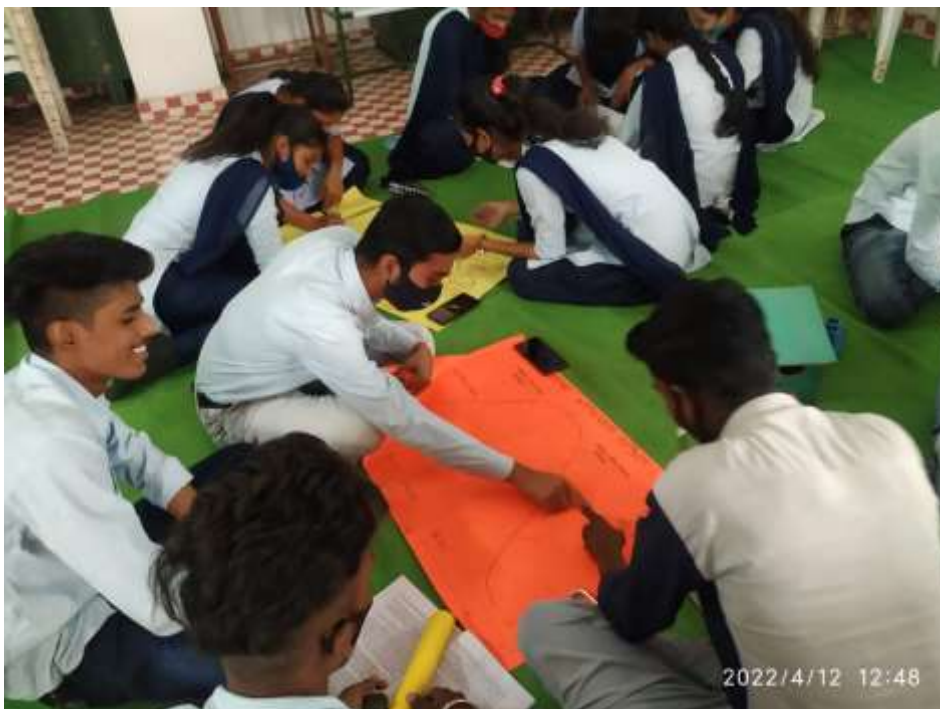
Working in groups

Here are some examples of students engaged in Project Based Learning.