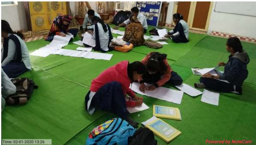
Students working on project data