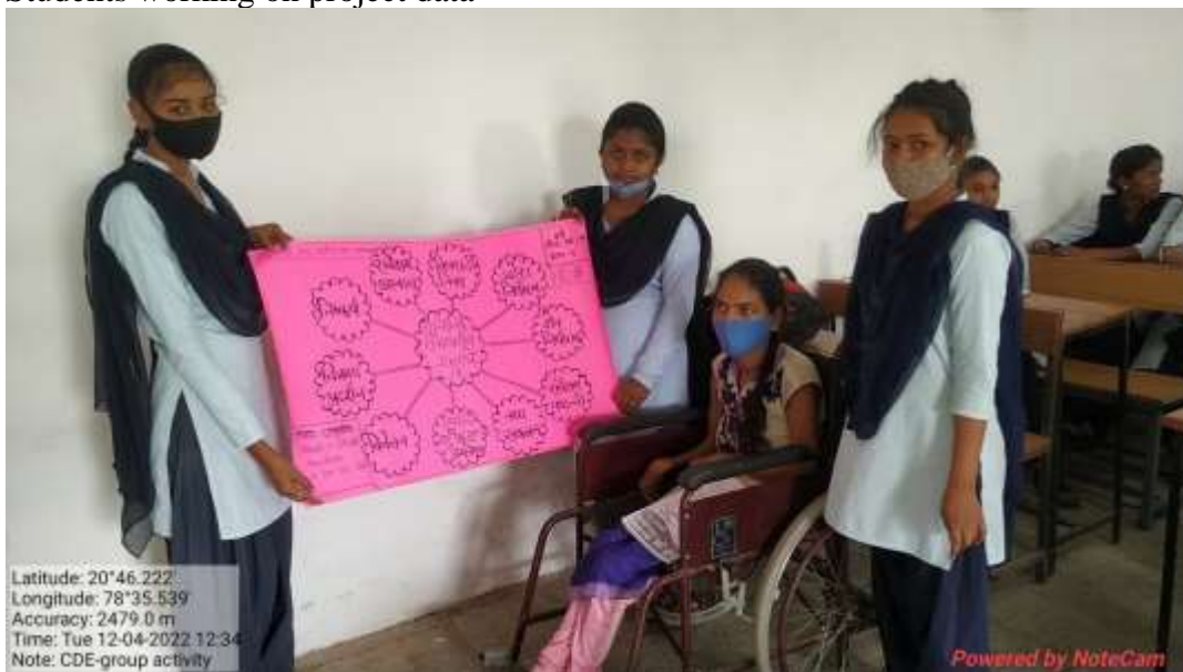
Creativity - Content analysis