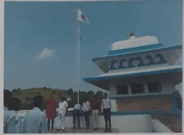
रासेयो वर्धापन दिन