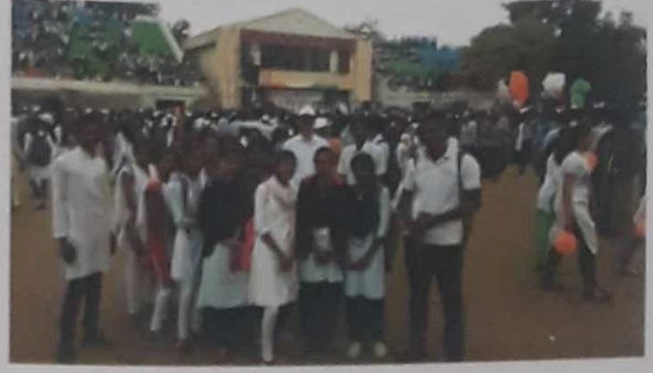
राष्ट्रीय मतदार दिन