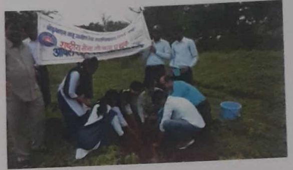
वृक्षारोपण आणि संवर्धन