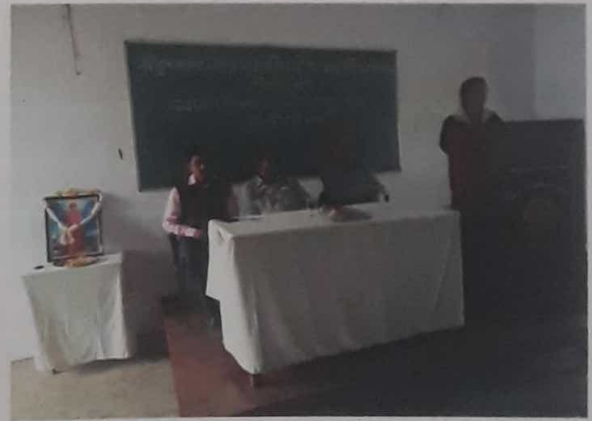
राष्ट्रीय युवा दिन