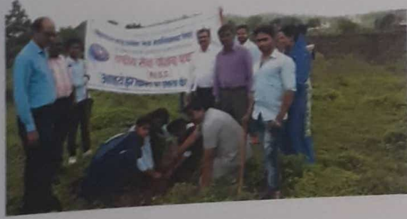
वृक्षारोपण आणि संवर्धन