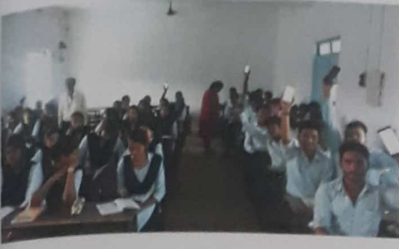
स्वच्छ सर्वेक्षण ग्रामीण - २०१८ सहभाग