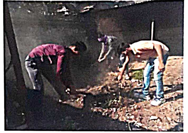
श्रमसंस्कार : कोंडवाडा स्वच्छता