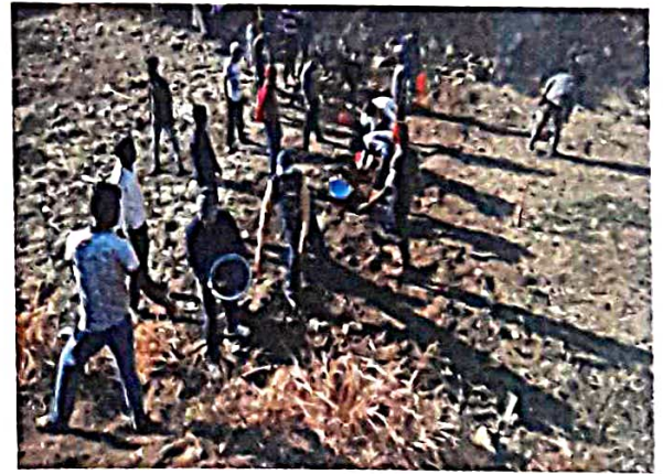
श्रमसंस्कार : बंधान्यातील गाळ उपसणे