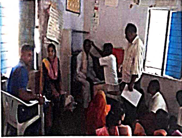
नेत्र तपासणी शिबिर