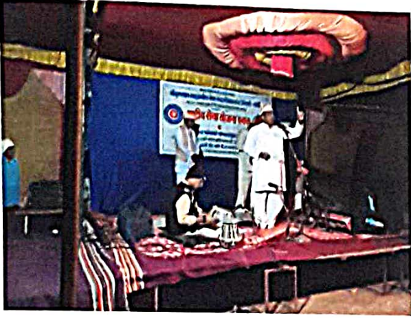
लोक प्रबोधन : कीर्तन