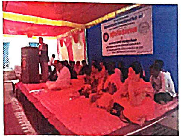
शिविर समारोप कार्यक्रम