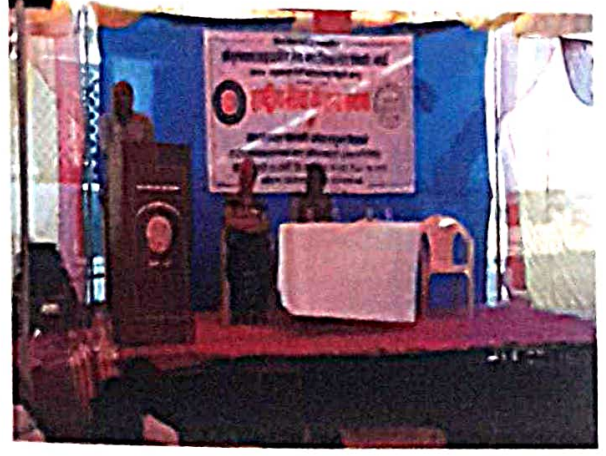
मार्गदर्शन सत्र : ग्रामविकासाचे उपक्रम