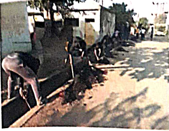
श्रमसंस्कार : नालीची स्वच्छता