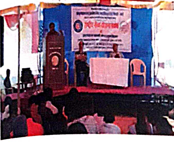
मार्गदर्शन सत्र : मशरूम उत्पादन व प्रक्रिया