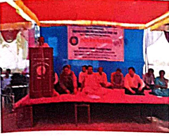
शिबिर उद्घाटन कार्यक्रम