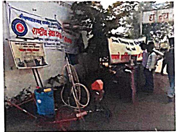
कृषी अवजारे प्रदर्शनी