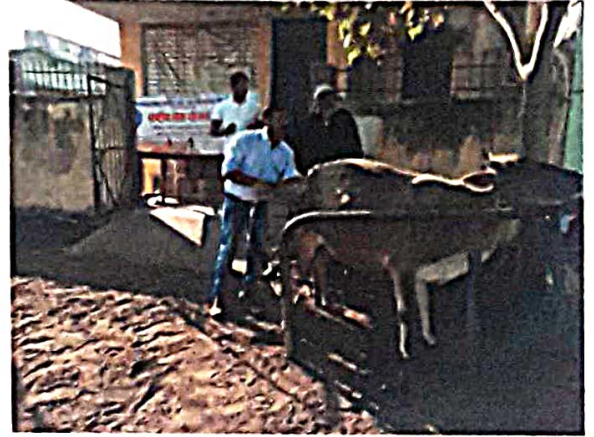
पशुचिकित्सा कृती शिविर