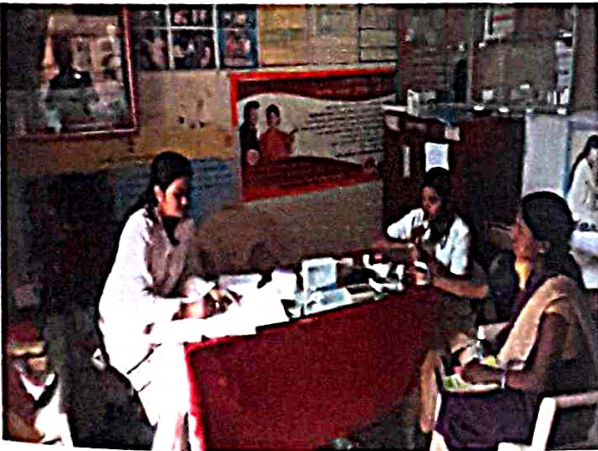
आरोग्य तपासणी शिबिर