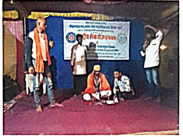
सांस्कृतिक कार्यक्रम : भोंदूबाबाची भंबेरी