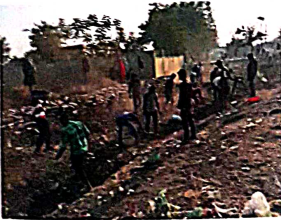
श्रमसंस्कार : नाला रुंदीकरण