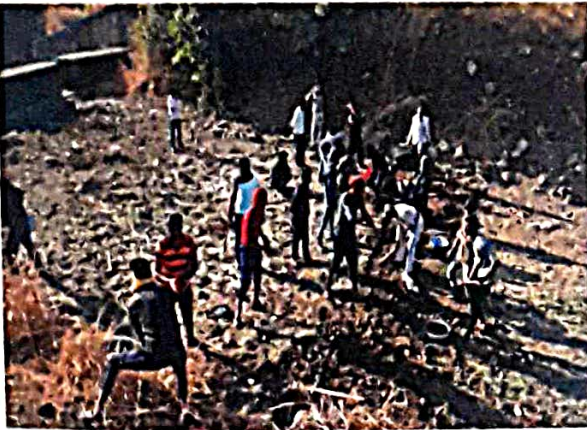
श्रमसंस्कार : बंधान्यातील गाळ उपसणे