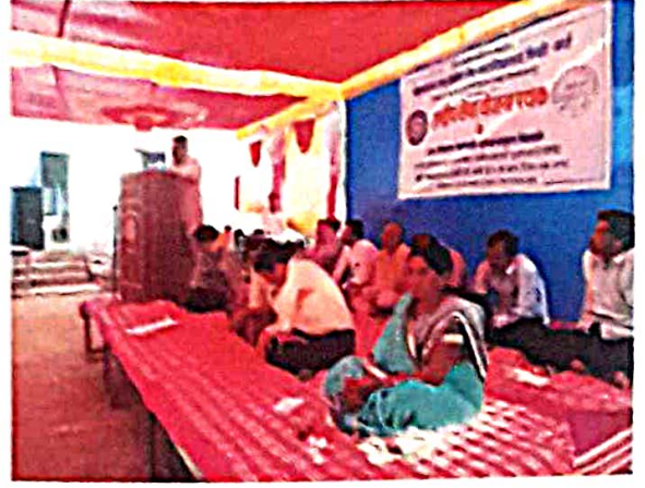
शिबिर उद्घाटन कार्यक्रम