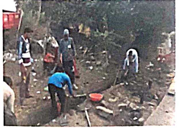
श्रमसंस्कार : नालीची स्वच्छता