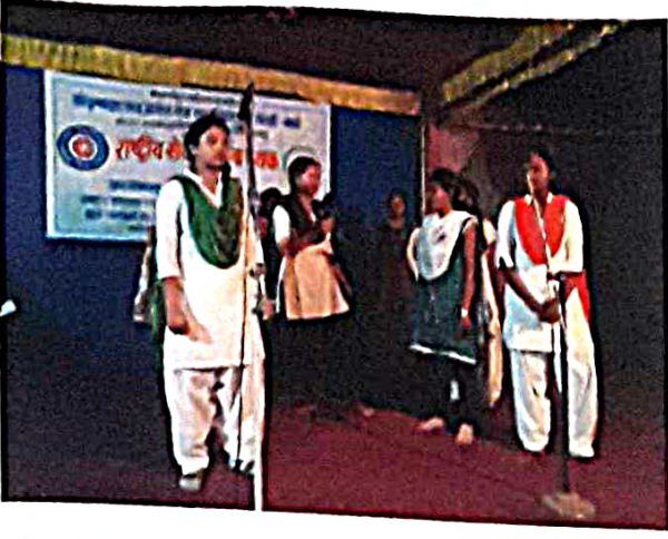
सांस्कृतिक कार्यक्रम : आम्ही लेकी कष्टकऱ्यांच्या