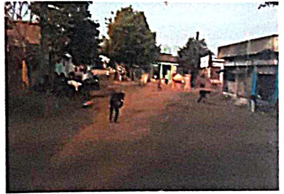
श्रमसंस्कार : मुख्य चौकाची साफसफाई