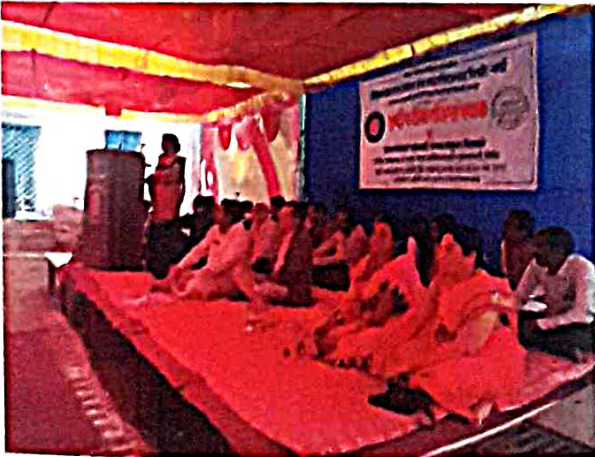
शिविर समारोप कार्यक्रम