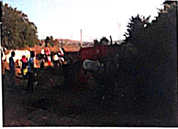
श्रमसंस्कार : नालीची स्वच्छता